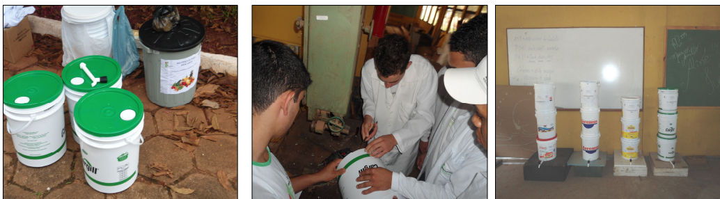
Figura 6, 7 e 8: Aula prática - Construção da composteira

Na aula prática, os grupos apresentados na tabela 1, receberam atribuições diferentes e em conjunto montaram a composteira (Figura 6, 7 e 8). Os materiais utilizados foram: 03 baldes de margarina 15kg; 01 torneira; serragem; folhas de árvores secas; 01 base de madeira 40x40x10cm; 01 pacote de minhocas californianas (280 un); resíduos orgânicos coletados na Instituição.